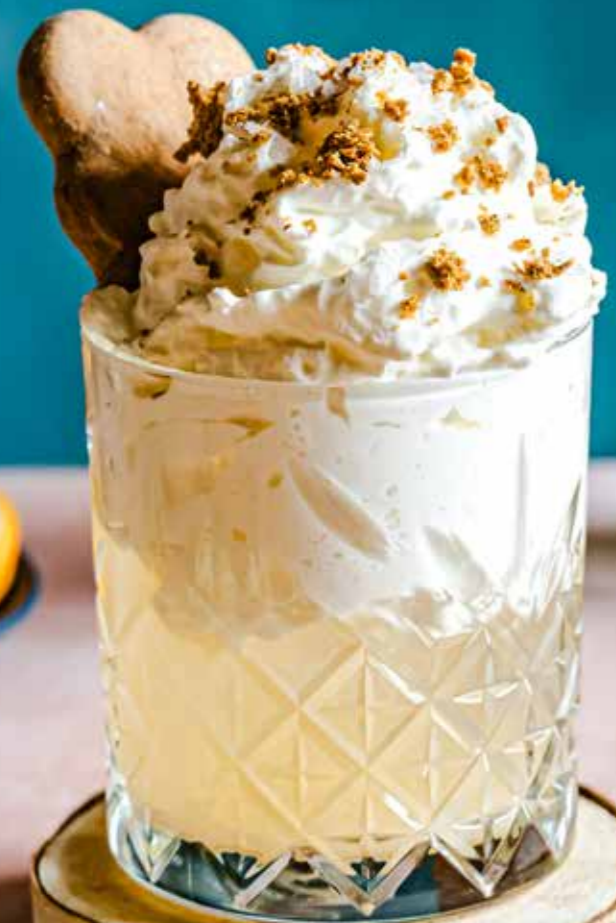
Pierniczek Toruński / Toruń's Gingerbread