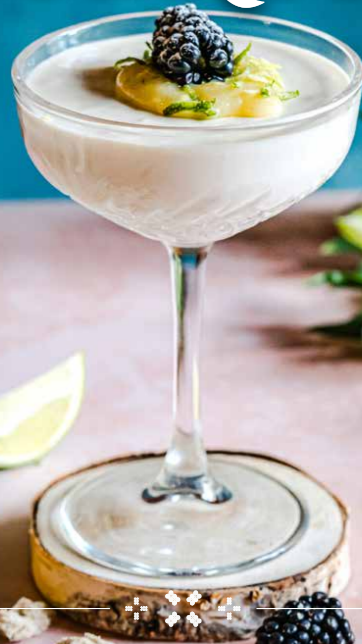
Mus chałwowy / Halva mousse