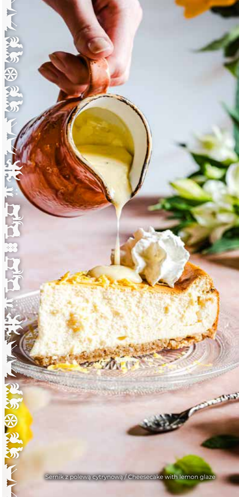
Sernik z polewą cytrynową / Cheesecake with lemon glaze

Prawdziwa bita śmietana 5,96 Genuine whipped cream